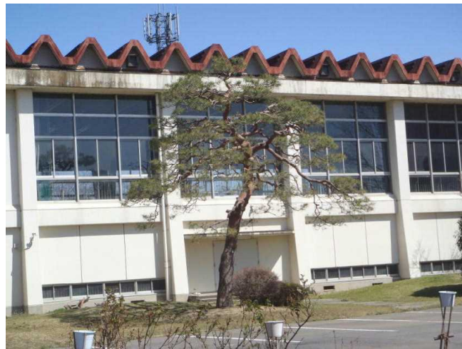
南中のシンボル『あかまつ』