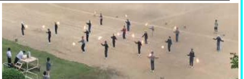
2年生、ファイヤーダンス練習風景